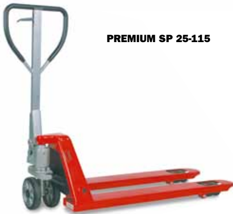
PREMIUM SP 25-115